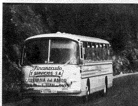
La «Caravana del Amor» corona el puerto de Desembarcos.