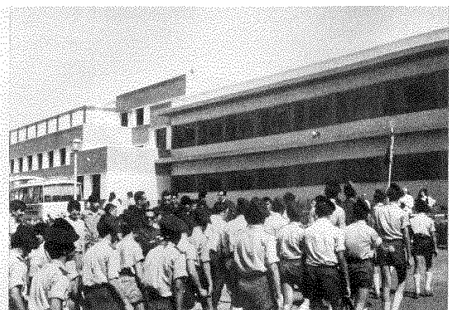
Los muchachos de la Organización Juvenil Española, ponen una nota marcial en las avenidas de la Ciudad de San Juan de Dios.

Luego, recorrido por las instalaciones y por la tarde a Sevilla, hasta el Ayuntamiento. Casi toda Sevilla aplaudiendo a rabiar a los componentes de la "Caravana del Amor" que desfilan en ochenta típicos coches de caballos sevillanos. Abre el cortejo la policía municipal motorizada y una banda de cornetas a caballo de la policía armada, siguen a continuación varios camiones del ejército del aire convertidos en carrozas de ilusión transportando a los chicos de San Juan de Dios, que no paran de entonar sevillanas. Después, los campeones de la Olimpiada, y en dos filas los coches de caballos con unos turistas de excepción, los escolares españoles, y cierra la caravana una banda de música que pone fiesta en los aires del atardecer sevillano. Y con la Plaza Nueva llena, el alcalde les dirige desde el balcón palabras emocionadas y vibrantes, cerrando así la festiva jornada.