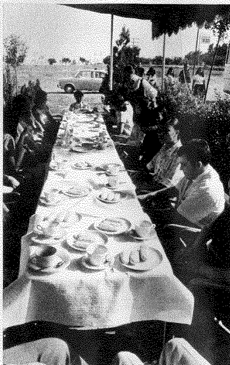
El desayuno al sol, una experiencia nueva para muchos de los chicos de la «Caravana del Amor».